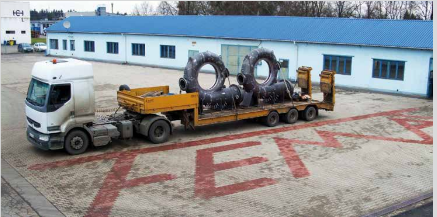
Die Lieferung an unsere Kunden organisieren wir mit unserer Hausspedition. We use our regular freight forwarder to organise delivery to our customers.